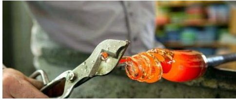
Un écrin en or et en cristal pour un parfum rare