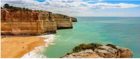
Road trip au Portugal (zème partie)